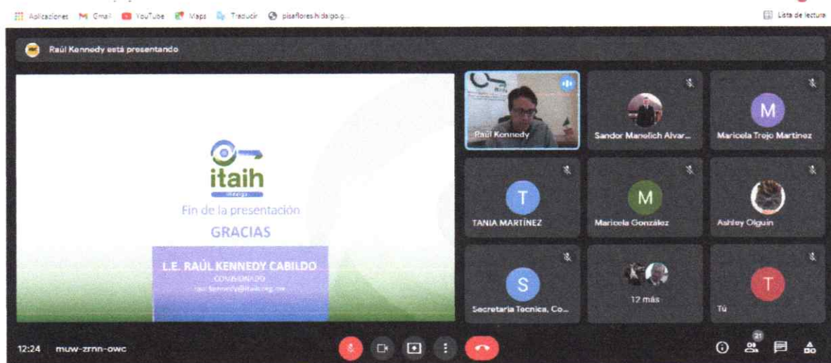
23/08/2021. CAPACITACIÓN VIRTUAL DE LA COMISIÓN PERMANENTE DE CONTRALORES ESTADO- MUNICIPIO REGIÓN VII.