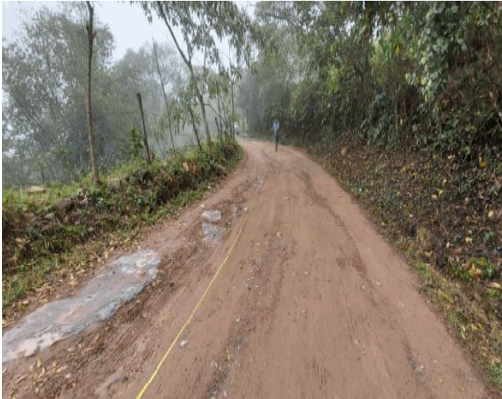
Análisis de la Oferta Actual: